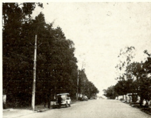
Fig. 2 — Rua São Benedito (subdistrito de Santo Amaro), em uma de cujas casas foi capturado o segundo P. megistus infetado.