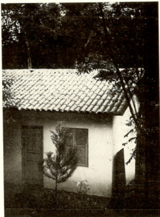
Fig. 1 — Casa da Chácara Flora, onde foi capturado o primeiro P. megistus infetado; notar a sua situação bem próxima de mata.

Em fevereiro do corrente ano, nôvo triatomíneo nos foi trazido para identificação e pesquisa de infecção pelo T. cruzi . Era outro P. megistus fêmea, capturado na casa n.º 1458 da Rua São Benedito, no mesmo bairro (Fig. 2). Dêste hemíptero retiramos