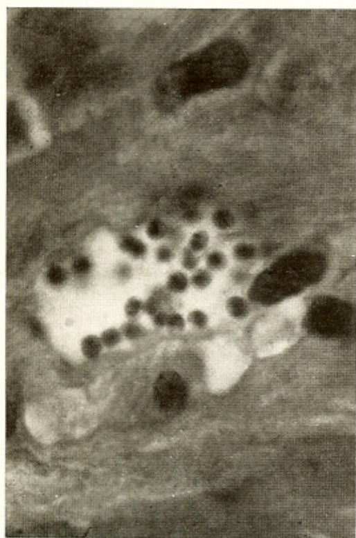
Fig. 5 — Ninho de formas em leishmânia em músculo cardíaco de camundongo. 1200 X

zeram estudos epidemiológicos em focos semelhantes no bairro de Santa Teresa, na Cidade do Rio de Janeiro. Quarenta cafuas foram negativas para triatomíneos, ao passo que 11 exemplares de P. megistus (6 fêmeas e 5 machos) foram capturados num grande edifício, estando nove infetados pelo T. cruzi . Dizem os Autores: "Positivamente tais insetos são atraídos pela luz (grande iluminação do edifício), seus focos de criação estando na mata". Com efeito, na mata circunjacente ao prédio, foram encontrados ninhos de gambá ( Didelphis marsupialis ), em palmeiras da espécie Attalea indaya Dr., onde também foram achados triatomíneos. De 42 gambás, submetidos a exame direto de sangue ou a xenodiagnóstico, 15 (33,7%) se mostraram naturalmente infetados pelo T. cruzi .