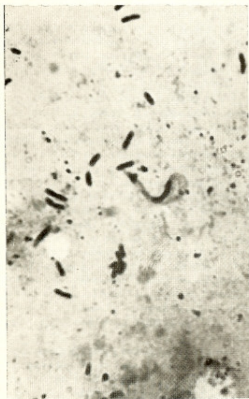
Fig. 3 — Trypanosoma do tipo do T. cruzi em fezes do triatomíneo. 1200 ×

Como se sabe, o P. megistus , sob o ponto de vista de sua ecologia, oferece-nos aspectos diferentes, colonizando-se em biótopos silvestres e domésticos. Nos Estados da Guanabara (Rio de Janeiro), São Paulo (Capital), Paraná (Curitiba), Santa Catarina (Florianópolis), isto é, em regiões do Sul do Brasil, com regimes de chuvas bem distribuídas, o P. megistus é encontrado em biótopos silvestres, até mesmo próximos ou dentro de centros urbanos, onde já foram encontrados exemplares da espécie. Em tais locais, êsses triatomíneos não são adaptados ao domicílio humano, onde não se criam, sendo apenas ocasionalmente encontrados. Assim, GUIMARÃES & JANSEN 7,8 fi-